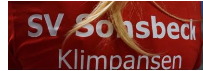
Projekt Kletterturm Sportverein Sonsbeck rev0